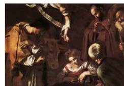
NATIVITÀ CON I SANTI LORENZO E FRANCESCO D'ASSISI MICHELANGELO MERISI (CARAVAGGIO) ORATORIO SAN LORENZO