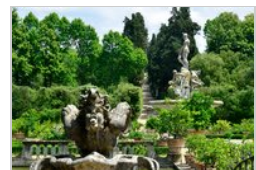
GIARDINO DI BOBOLI FIRENZE