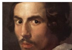
GIAN LORENZO BERNINI