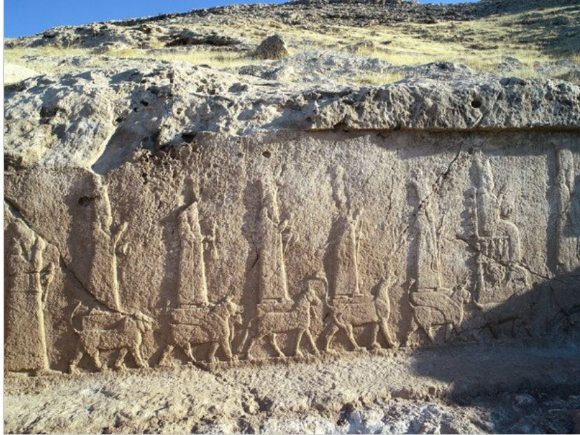
I rilievi assiri del canale di Faida.