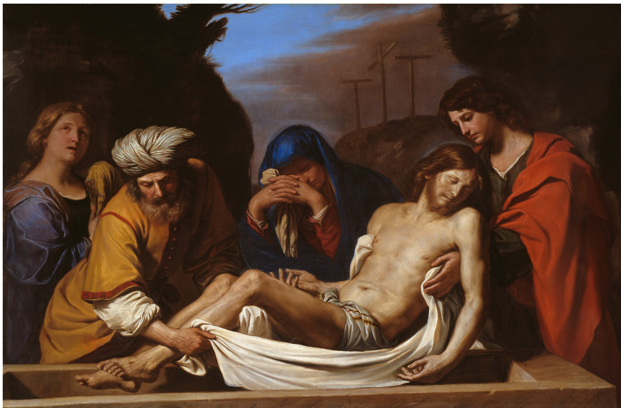
Guercino, Deposizione di Cristo nel sepolcro , 1656, Chicago, The Art Institute